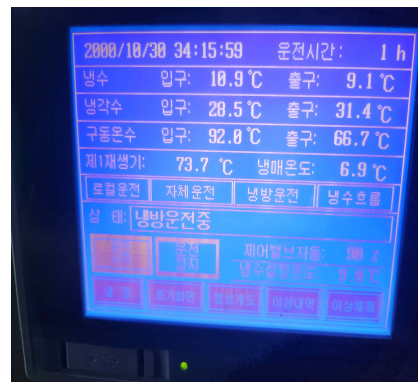
(정비후 시운전 테스트)