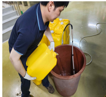
(흡수액 투입 작업)