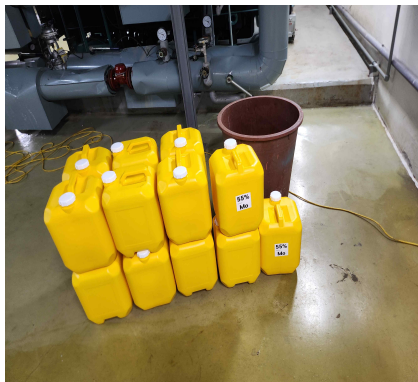
(흡수액 농도 조절을 위한 흡수액 반입)