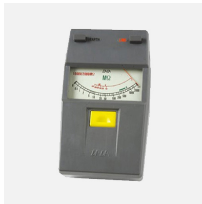
절연저항 측정기 (500V, 100MΩ)