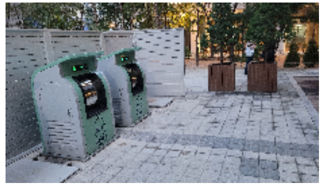
넥서스 뒷편 크린넷 공간