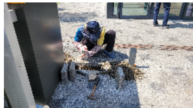
제니스 뒷편 크린넷 공간