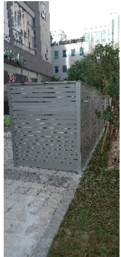
건물 뒷편 공간