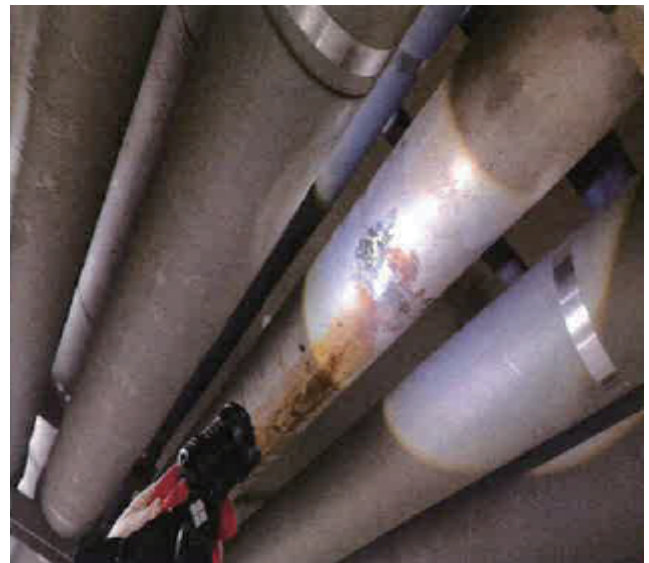
배관 손상 부분